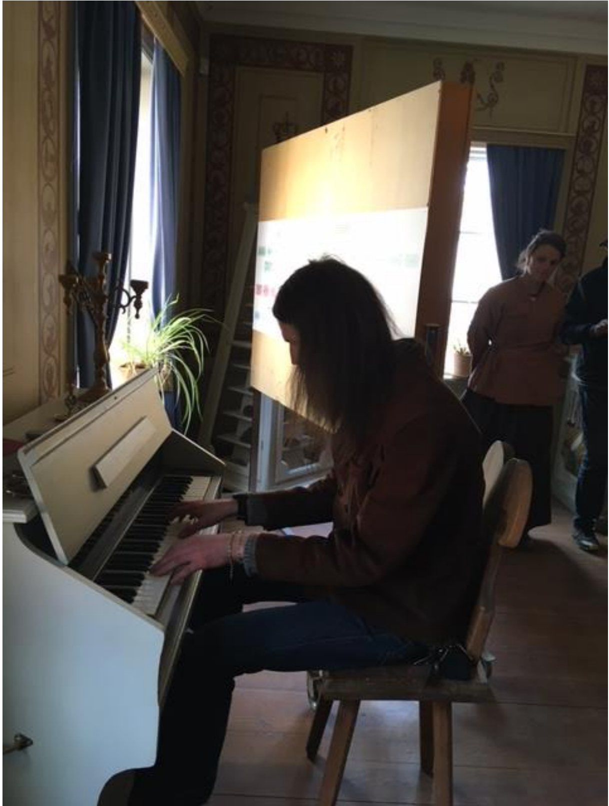
Lite musik av vår extra guide på en gammal Orgel i Tingsalen.