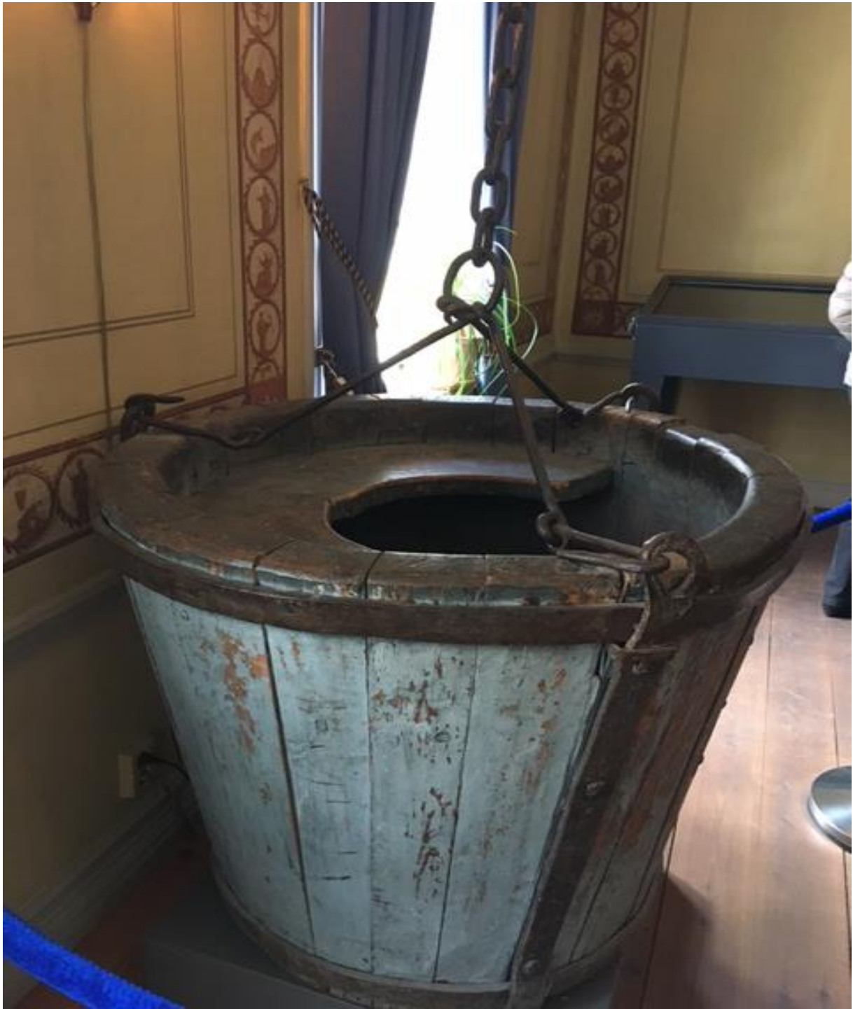
Gamla hissen ner till 155 meter