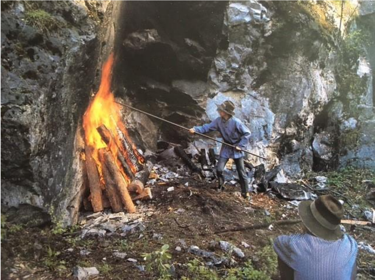
En rekonstruktion av eldsättning som användes på 1500-talet